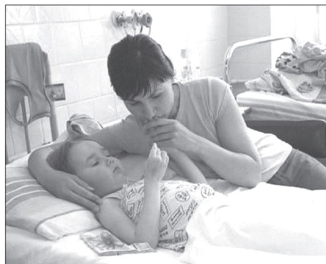
Любому больному необходима поддержка близких, а ребёнку-инвалиду — особенно

По его словам, в России в настоящее время насчитывается около 700 тысяч несовершеннолетних граждан, имеющих инвалидность. С учетом их родителей и близких, проблемы детей-инвалидов затрагивают миллионы людей.