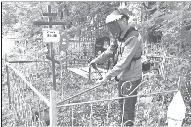
Волонтеры ГДК позаботились о местах захоронения бывших работников культуры

Волонтеры Городского дома культуры провели акцию в День солидарности в борьбе с терроризмом. Они привели в порядок мемориал детям Беслана, установленный на Никольском кладбище.