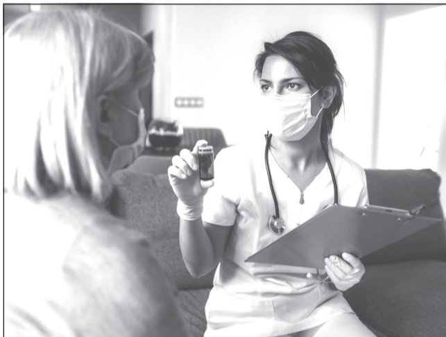
Новый пакет мер поддержки поможет медикам остаться работать в Ивановской области

Губернатор Станислав Воскресенский анонсировал новые меры поддержки медиков.