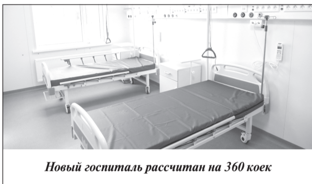
Новый госпиталь рассчитан на 360 коек

Как напомнил зампред правительства Ивановской области Сергей Коробкин, к строительству объекта приступили в 2020 году. Контракт на возведение инфекционного госпиталя подразумевает и проектирование, и строительство единым поставщиком. За основу был взят типовый проект. «В результате привязки объекта к условиям земельного участка на территории областной больницы потребовалось строительство дополнительных площадей, также добавлены необходимые для функционирования