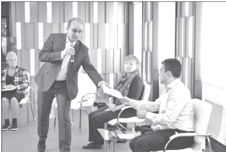
Встреча с активом ветеранских организаций

Данное решение коснется 14 тысяч человек.