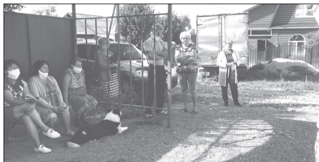
Главной проблемой селян является благоустройство их населённого пункта

Штаб общественного диалога г. Приволжска провел собрание с жителями д. Ширяиха Ингарского сельского поселения.