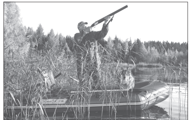
Главная опасность на воде - переворачивание лодки

В случае возникновения пожара следует накрыть двигатель рюкзаком, плащом, курткой и т.п., чтобы исключить попадание воздуха в очаг возгорания или сбить пламя теми же вещами. Если это не удастся, лучше всего покинуть лодку, чтобы не