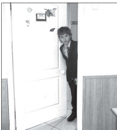
Новый учебный год начался в очном формате

Отдел образования в рамках операции «Всеобуч» провел мониторинг зачисленных и приступивших к обучению с начала 2021-2022 учебного года. Комплектование 1-11 классов общеобразовательных школ Приволжского района продолжалось до 5 сентября.