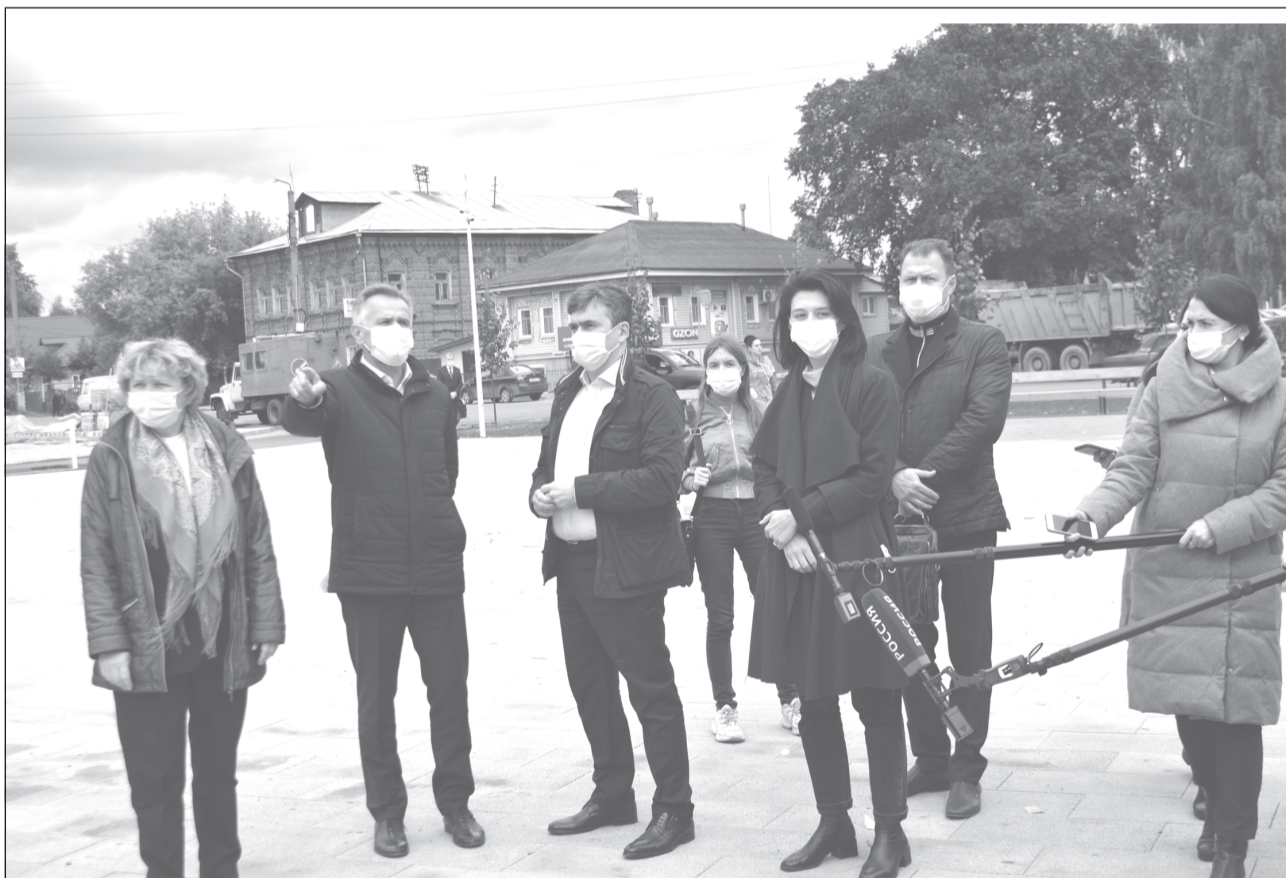
Станислав Воскресенский обсудил с подрядчиками и авторами проекта проблемы текущих работ

Вчера с рабочим визитом Приволжск посетил губернатор Ивановской области Станислав Воскресенский.