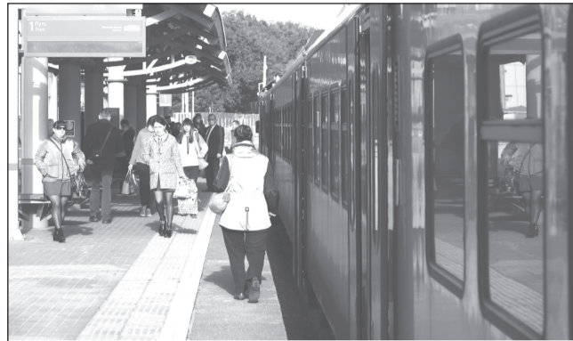
Теперь шуянам будет удобнее добираться на работу и обратно.